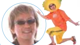
レモンさん(山本シュウ) (ラジオDJ)