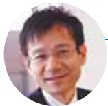
鈴木寛 (参議院議員)